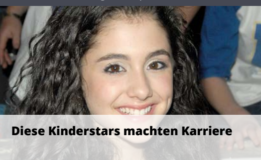
Diese Kinderstars machten Karriere