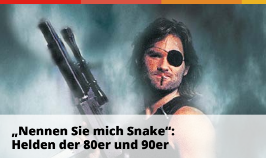
„Nennen Sie mich Snake“: Helden der 80er und 90er

Landsberger Straße 336 • 80687 München • Tel.: 089 14 34 19-0 • Fax: 089 14 34 19-19 • marketing@teleschau.de • www.teleschau.de