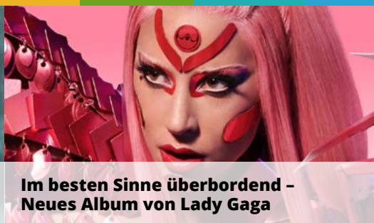
Im besten Sinne überbordend – Neues Album von Lady Gaga