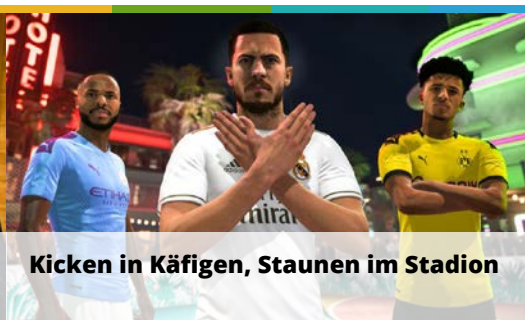
Kicken in Käfigen, Staunen im Stadion