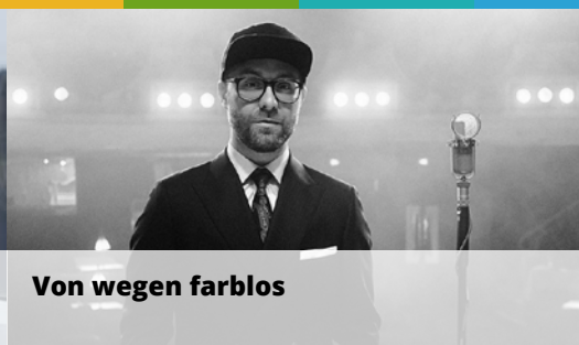
Von wegen farblos