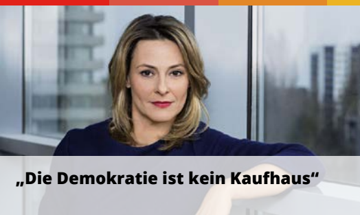
„Die Demokratie ist kein Kaufhaus“

Landsberger Straße 336 • 80687 München • Tel.: 089 14 34 19-0 • Fax: 089 14 34 19-19 • marketing@teleschau.de • www.teleschau.de