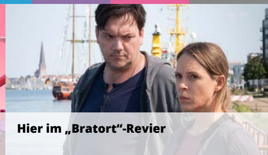
Hier im „Bratort“-Revier

Vollständige Beispielartikel finden Sie auf unserem Showcase: https://showcase.teleschau.de/themenbereiche