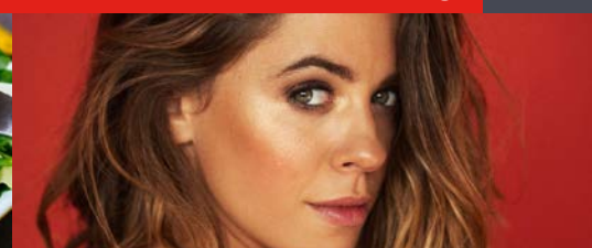
„Froh, dass alles so gekommen ist“