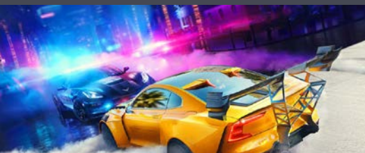
Zurück im Bleifuß-Paradies?

Vollständige Beispielartikel finden Sie auf unserem Showcase: https://showcase.teleschau.de/themenbereiche