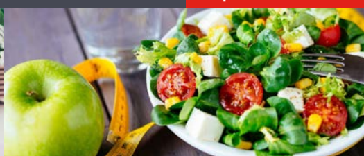
Greifen Sie zu! Diese Lebensmittel haben so gut wie keine Kalorien