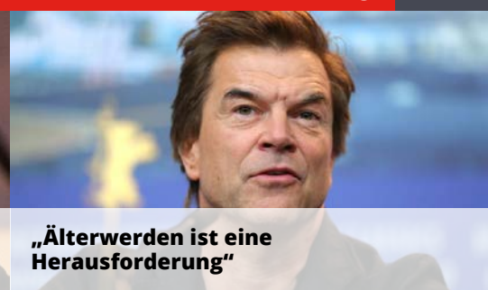
„Älterwerden ist eine Herausforderung“