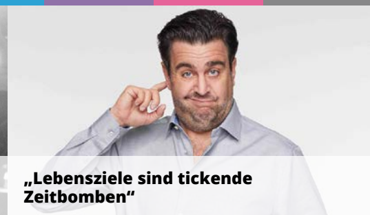
„Lebensziele sind tickende Zeitbomben“

Vollständige Beispielartikel finden Sie auf unserem Showcase: https://showcase.teleschau.de/themenbereiche