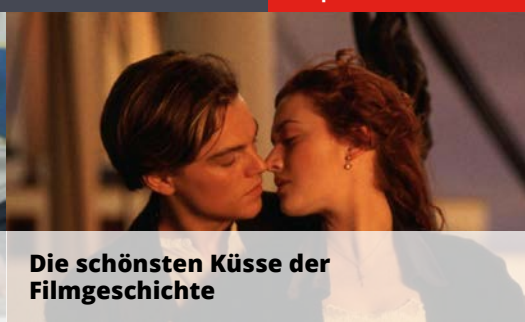
Die schönsten Küsse der Filmgeschichte