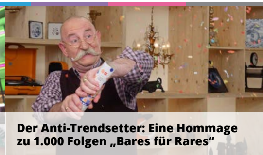
Der Anti-Trendsetter: Eine Hommage zu 1.000 Folgen „Bares für Rares“