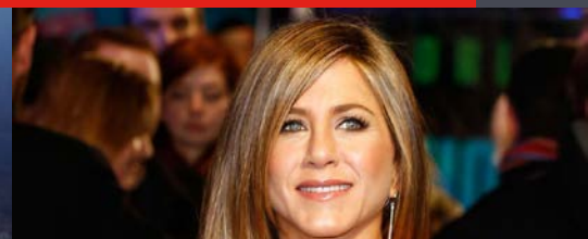
Diese Promis haben die meisten Instagram-Follower